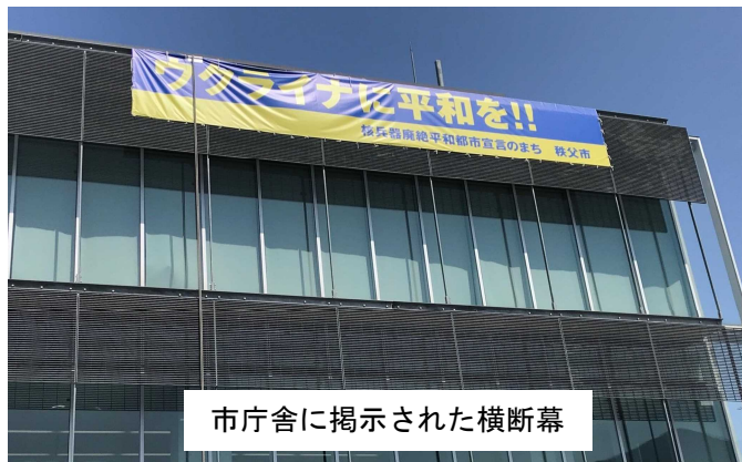
市庁舎に掲示された横断幕

そこで、ふるさと納税制度を活用して、ウクライナへの人道支援寄附金を募集するほか、市役所に募金箱を設置して寄附金を受け入れ、事務費等の経費を控除することなく、寄附金の全額をウクライナ大使館へ寄附することで、ウクライナの避難民保護やインフラ復旧等の支援を行います。(ふるさと納税によりウクライナ支援の寄附金を募集するのは、県内では吉川市、深谷市に続いて三例目となる見込みです。)