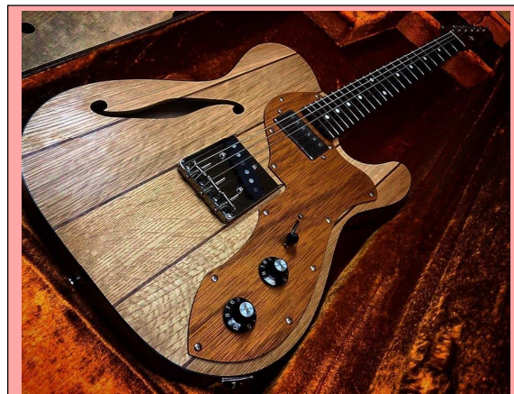
補助金を活用し、秩父産木材を使用して作製したエレキギター

秩父地域1市4町、国、県、林業関係者で組織する「秩父地域森林林業活性化協議会」では、森林・林業活性化の推進に共同で取り組んでおり、森林保全・活用を目的とする将来性・持続性のある新たなビジネスプランなどに補助金を交付する「秩父地域森林活用等創出支援事業補助金」の募集を開始します。